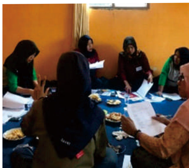
Gambar 1. Pertemuan diskusi kelompok peternak wanita membahas manajemen bisnis peternakan.

"Saya belajar bahwa peternak sapi perah yang hebat adalah mereka yang menghasilkan uang (keuntungan) dengan menerapkan keterampilan teknis terbaik di kandangnya," kenangnya terhadap materi yang dibahas selama diskusi kelompok.